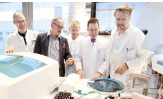
Zentrallabor: Alle Analysen auf einer Etage _19