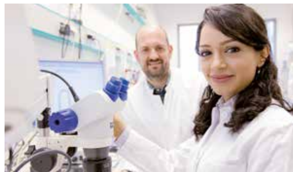
Kardiologie: Das Protein, das Herzen repariert _31