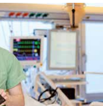
ademie: Mehr Qualität