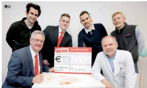
Im Einsatz: REWE-Azubis sammeln