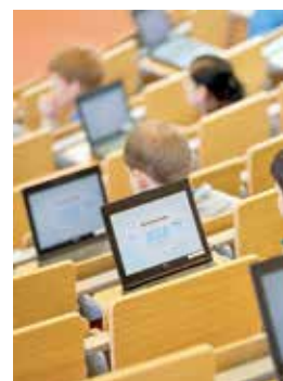
Im Fokus: Zehn Jahre E-