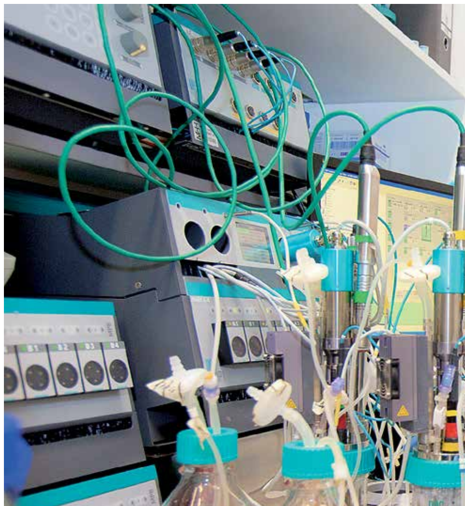
In Massen: REBIRTH-Forscher wandeln pluripotente Stammzellen in Herzmuskelzellen um