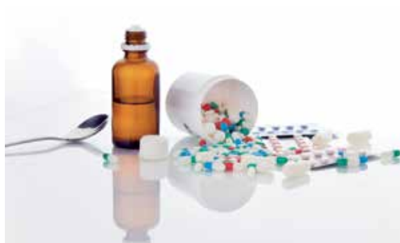
Im Team: Sichere Arzneimittel