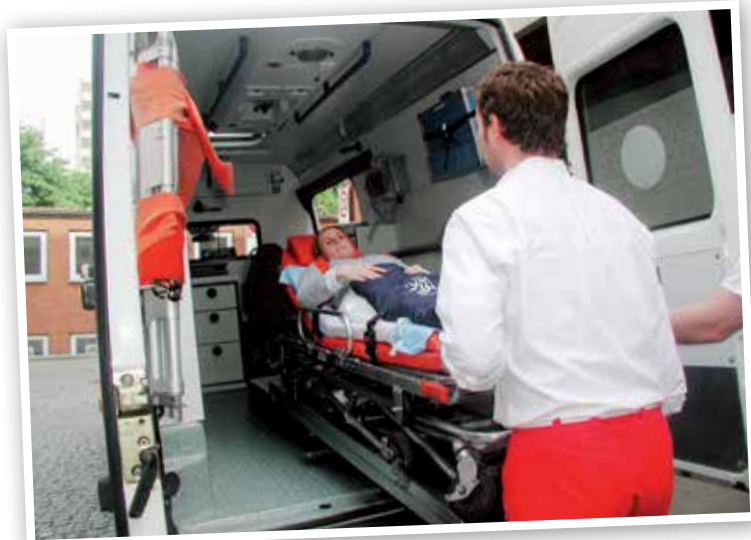
Das prägende Ereignis: der Umzug der Frauenklinik.