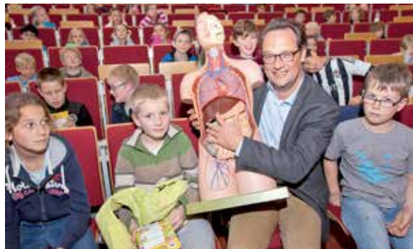
Mit der KinderUni durch den Körper Seite 56