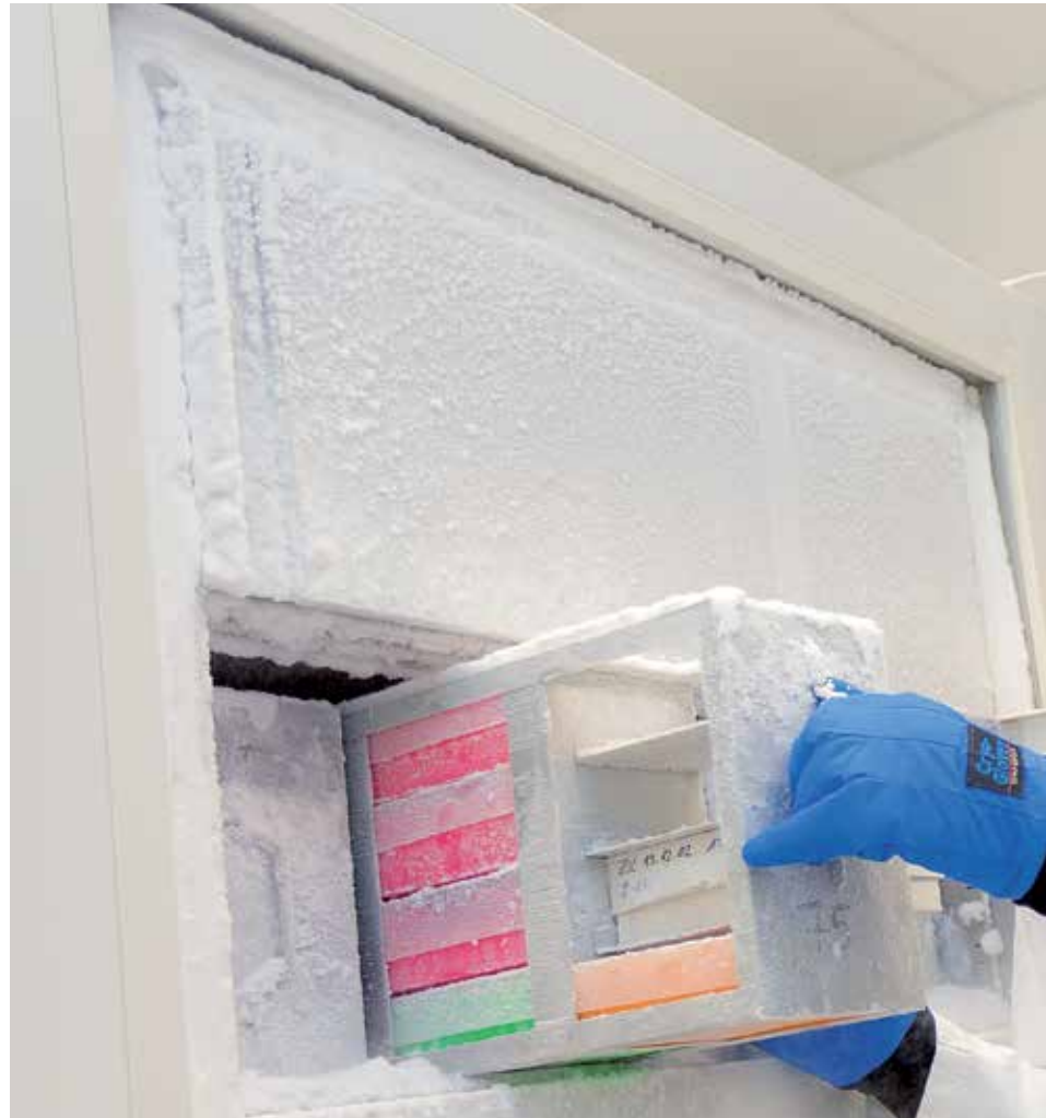
Mit Biomarkern erfolgreich: TapSAKI zeigt bei Intensivpatienten Nierenschäden an