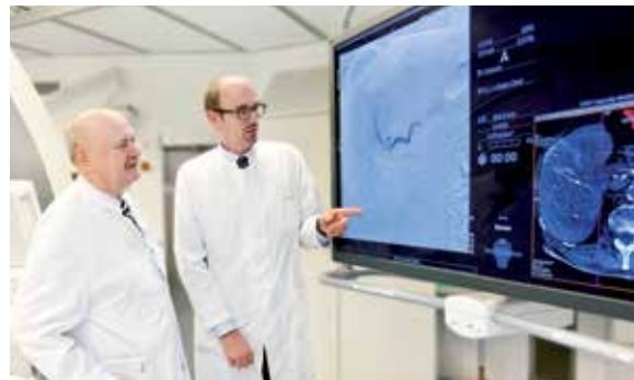
Im Team gegen Lebermetastasen