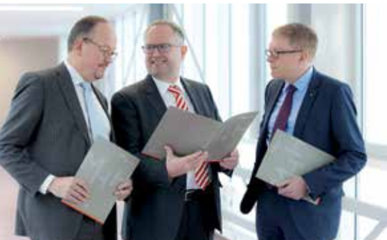
Das Grußwort zum Jahreswechsel