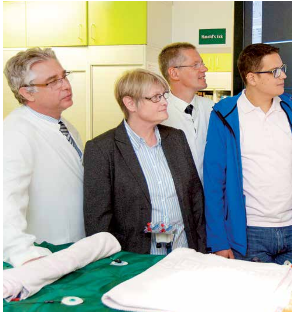
Alles aus einer Hand: Zertifiziertes Zentrum für Erwachsene mit angeborenen Herzfehlern