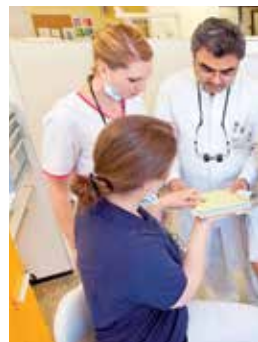
Neuester Stand: Studierende