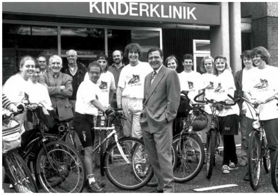
.. unterstützte Gerhard Schröder Aktionen für krebskranke Kinder in der MHH-Kinderklinik.