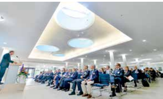
Neubau: Das CRC Hannover ist eröffnet Seite 18/19