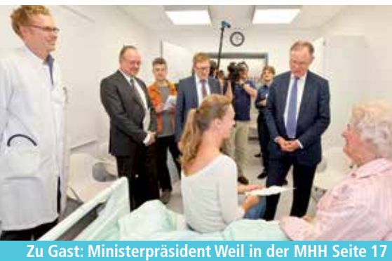
Zu Gast: Ministerpräsident Weil in der MHH Seite 17