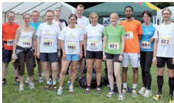
Ausdauer: Team läuft Behördenmarathon