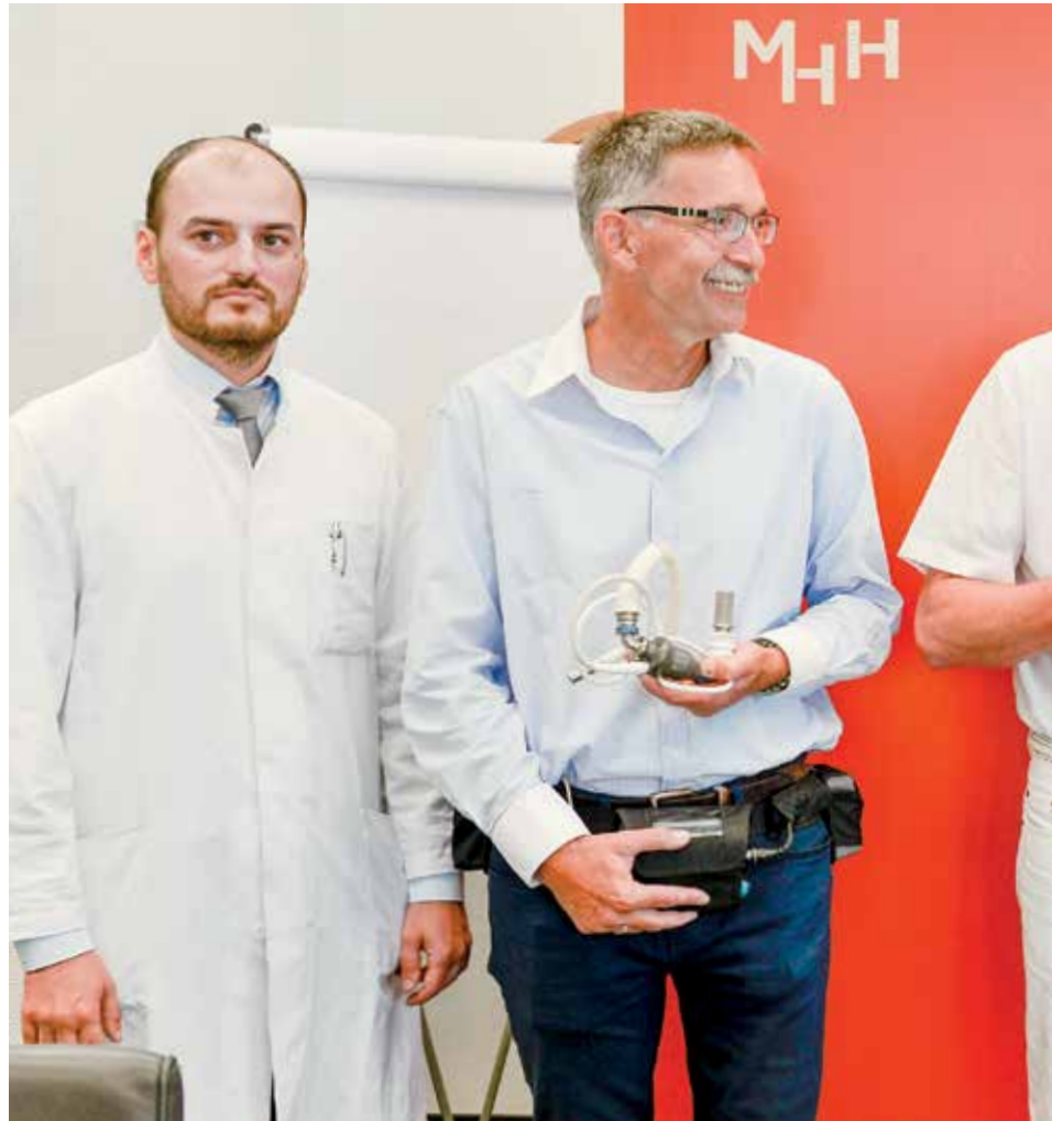
Mehr Lebensqualität dank Kunsterz: Miniaturpumpen der dritten Generation gewinnen