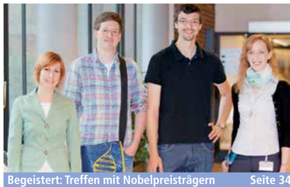
Begeistert: Treffen mit Nobelpreisträgern