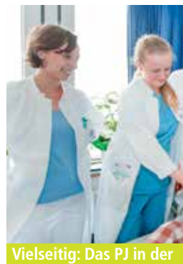
Vielseitig: Das PJ in der