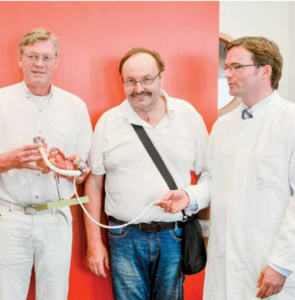
angesichts fehlender Spenderorgane an Bedeutung