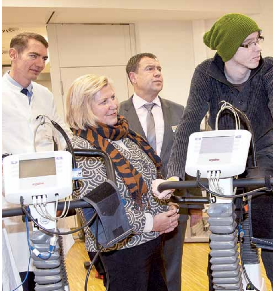
Ehrgeiz wecken: Sportmediziner und Onkologen bieten jungen Patienten schon während der