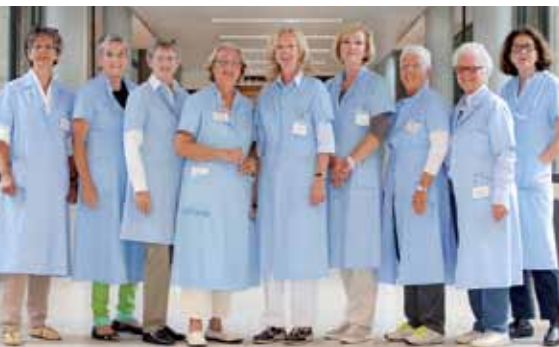
Wahre Engel: Die „Blaue Damen“ _18