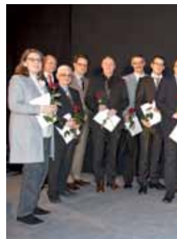
Die Besten: Preise für g