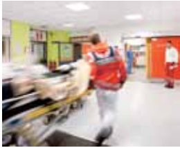
Karin Kaiser fotografierte die Ereignisse in der Notaufnahme.