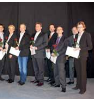
...te Lehre verliehen