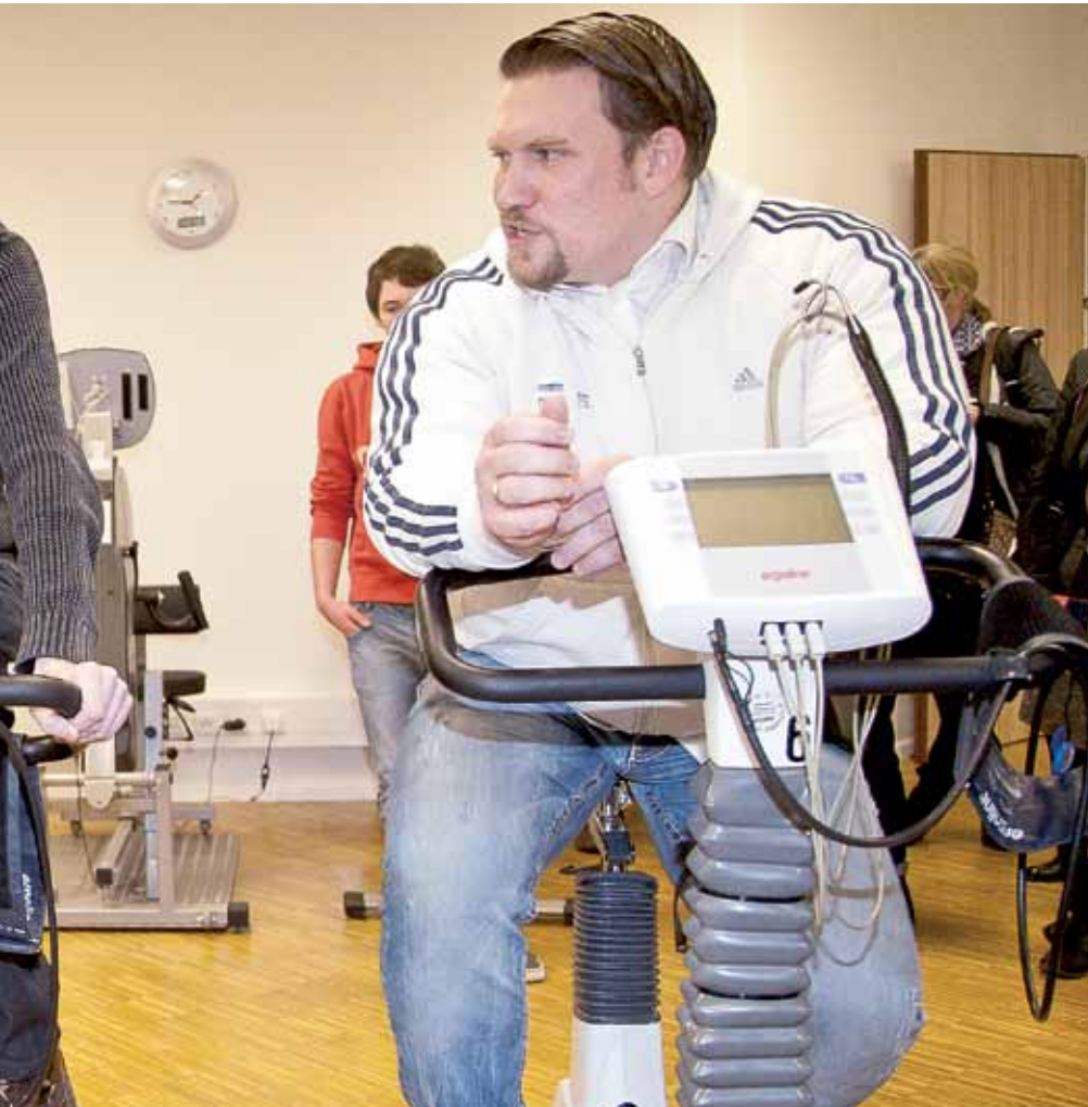
Chemotherapie ein Bewegungsprogramm