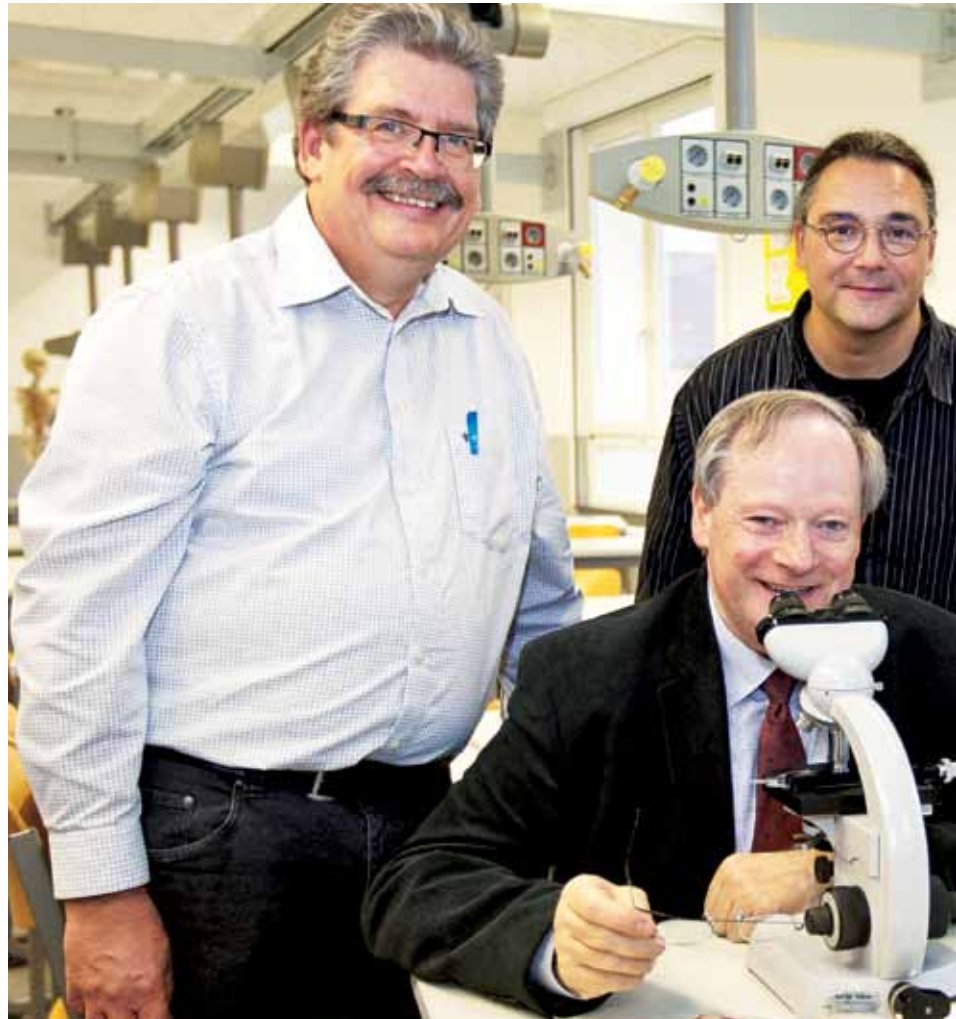
Geschenk an Schulen: Mikroskopiersaal erhält neue Technik – die alte wird weiter genutzt