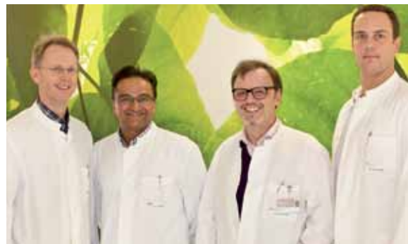
In besten Händen: Check für Führungskräfte _35