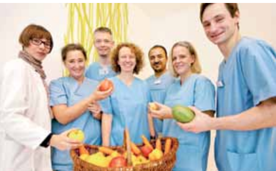
Neues Modell: Der Weg aus der Stress-Falle _34