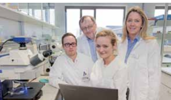
Ausgezeichnet: Forscher erhalten Köhler-Preis _17