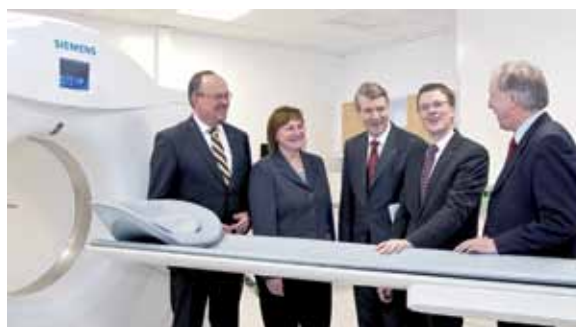
Modernisiert: Nuklearmedizin mit neuem PET/CT _35