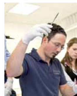
In Betrieb: Das Skills La