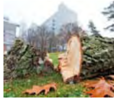
Für das Titelbild hat Fotografin Karin Kaiser mit der Baustelle am Gebäude K2 gepuzzelt.