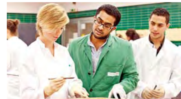
Der erste Schnitt: Besuch im Präparationskurs