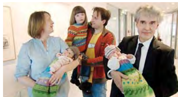
Zwei Projekte, ein Ziel: Hilfe für Kinderherzen