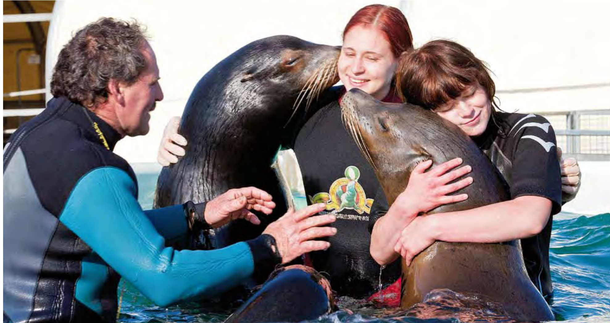
Schmusen mit den Seelöwen: Patienten der MHH-Psychiatrie besuchen den Circus Krone