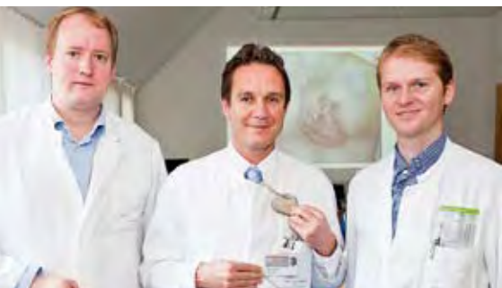
Weltweit erstmals: MRT-fähiger Defibrillator