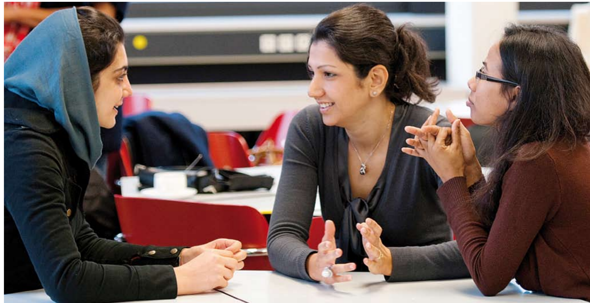
Kulturgrenzen überwinden: Mit dem Programm IsiE med unterstützt die Medizinische Hochschule ausländische Studienanfänger