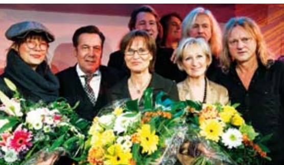
Einsatz belohnt: Preis für Krankenschwestern _21