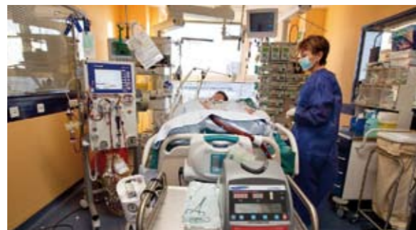
Respektvoll: Zehn Jahre Klinisches Ethik-Komitee _34