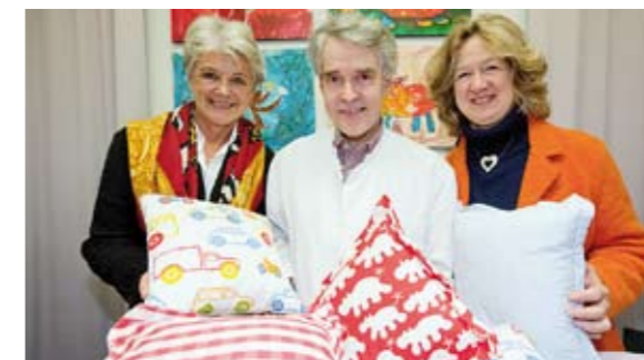
Bürgermeisterin näht: Kissen für kranke Kinder _56