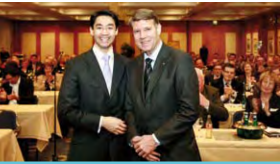
Klausurtagung – mit dem Minister _18