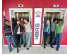
Für das Titelbild fuhr Fotograf Bodo Kremmin mit Studierenden mit Studierstuhl.