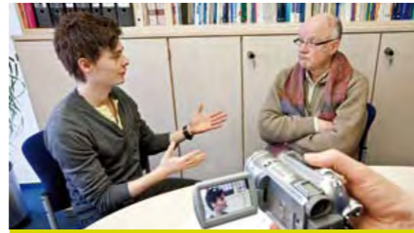
Schauspielpatienten im Einsatz _49