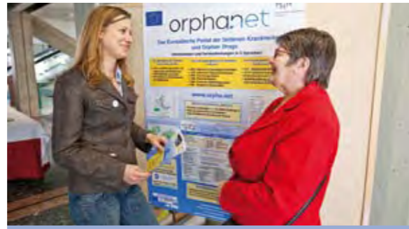
Orphanet informiert über seltene Krankheiten _45