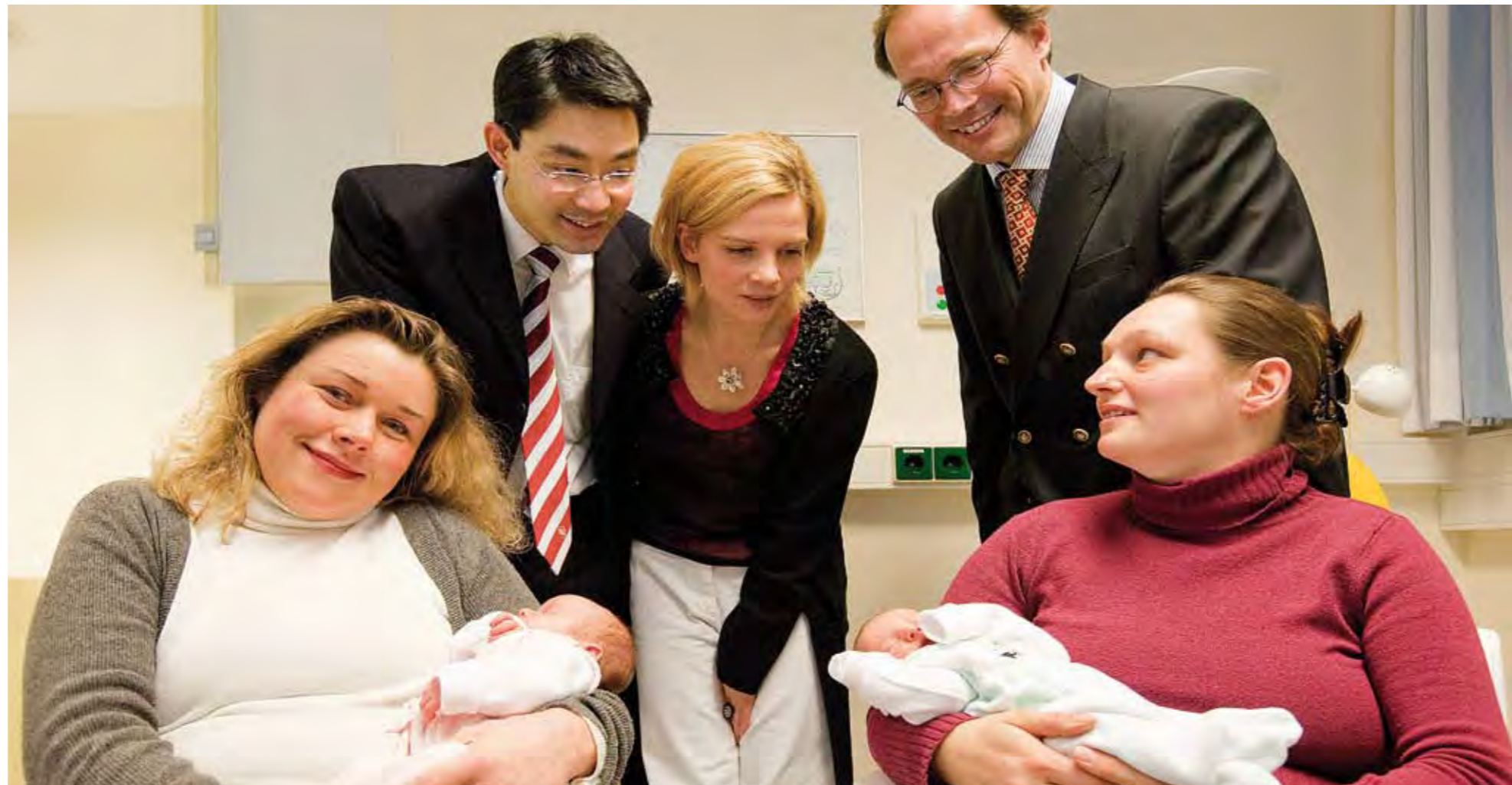
Minister Rösler überbringt das Zertifikat: MHH-Frauenklinik ist als einzige Klinik in der Region Hannover als babyfreundliches Krankenhaus ausgezeichnet worden