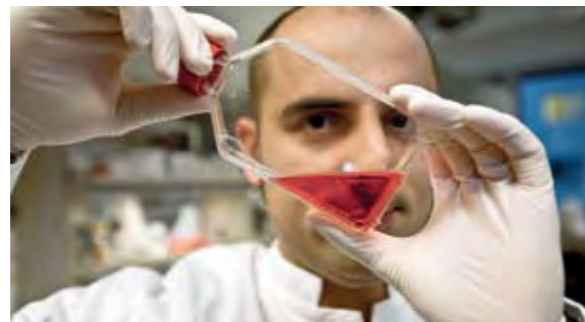
Forschung gegen den Schlaganfall