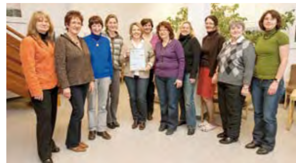
MTA – Beruf mit Zukunft