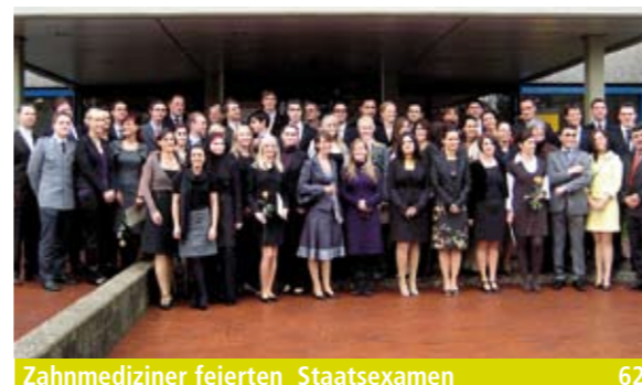
Zahnmediziner feierten Staatsexamen _62