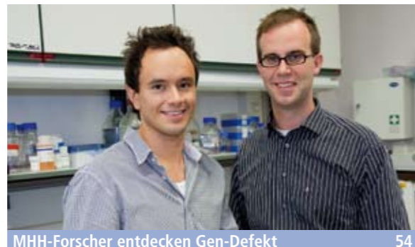
MHH-Forscher entdecken Gen-Defekt _54