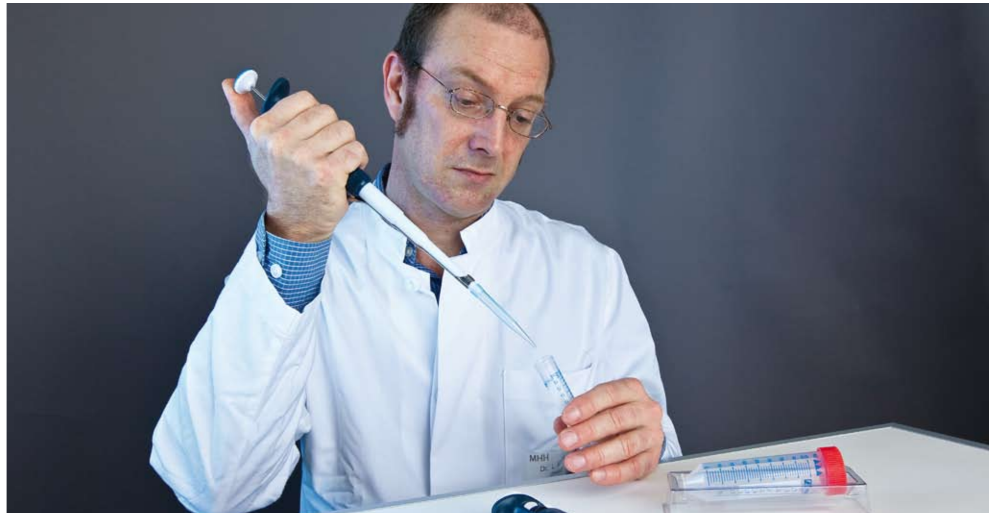
Exzellenter Einsatz: REBIRTH-Forscher in der MHH _6