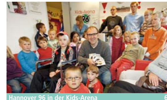
Hannover 96 in der Kids-Arena _65