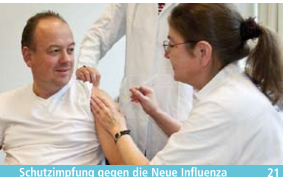
Schutzimpfung gegen die Neue Influenza _21