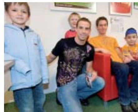
Gab Autogramme: 96-Profi Jan Schlaudraff.

sation, Aufbau und Durchführung. Zudem spendeten sie den Erlös in Höhe von 1.500 Euro aus dem Verkauf von Speisen und Getränken. Weitere 1.000 Euro spendete TUI Infotec. bb