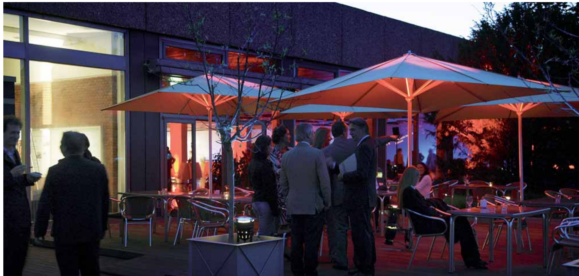
Jahresempfang der MHH: XXX _20