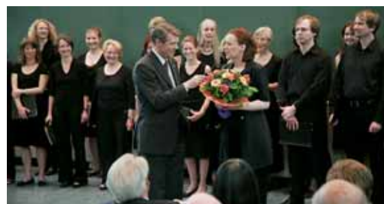
Promotionsfeier: MHH-Chor sang _54