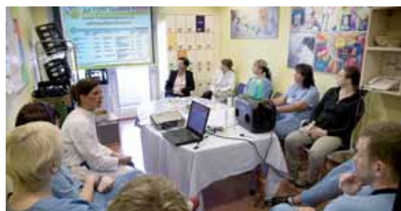
Gegen Infektionen: Aktion „Saubere Hände“ _37