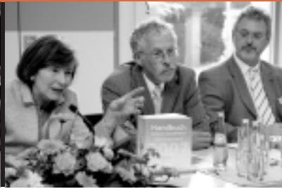
30 Vorstellung Handbuch