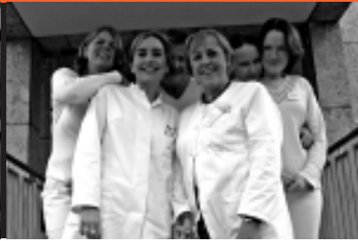
26 PJ Allgemeinmedizin