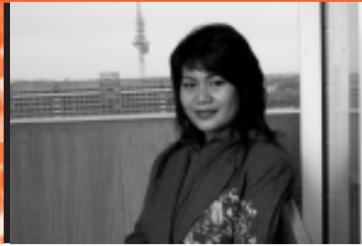
56 Leben auf dem Campus