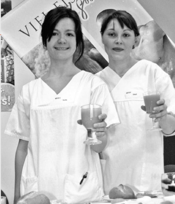
16 Zwischenprüfung bei den Diätassistentinnen