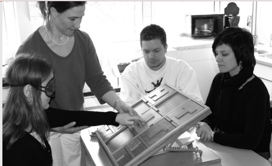
24 Studierende erproben Umgang mit Patienten