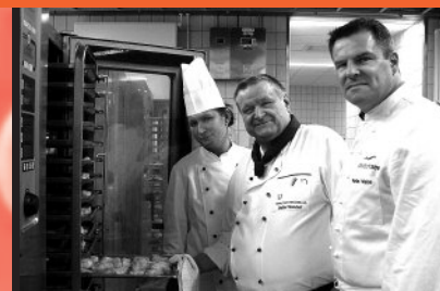
48 Expo-Köche in der Mensa