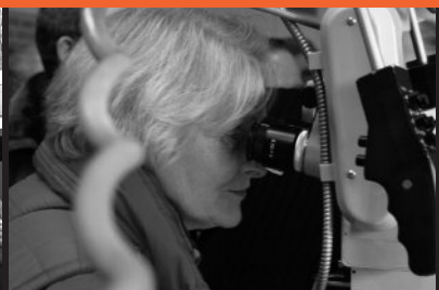
12 Tag der Gesundheitsforschung