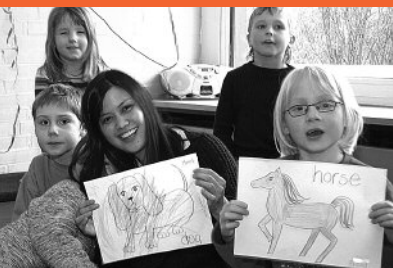
9 Englisch in der Kita