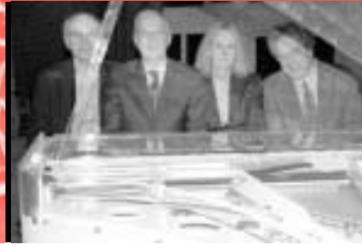
50 Gläserner Flügel