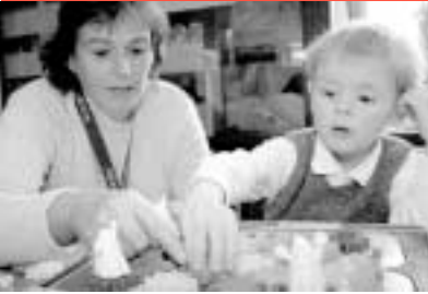
9 Tag der Gesundheitsforschung