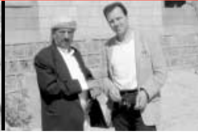
28 Kinderchirurgie im Jemen