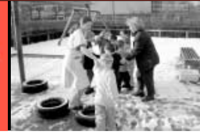
49 Evakuierung Kindergarten