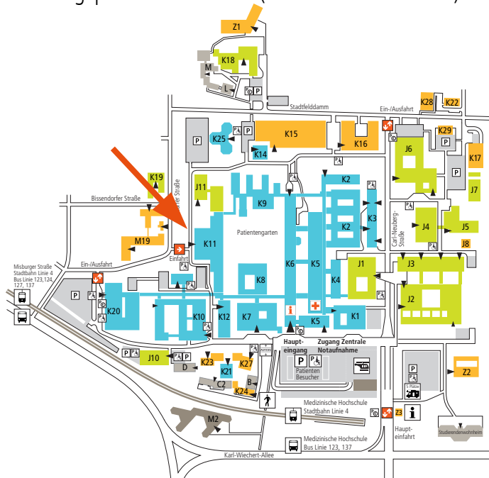
Lageplan MHH-Gelände (Cave: nur für 7.5.2019)