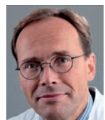
Univ.-Prof. Dr. med. Peter Hillemanns

es ist uns eine große Freude, Sie im Namen der NCCC zur 132. Tagung vom 08. bis 09. September 2017 nach Hannover einzuladen. An „alt bewährte“ lokale Traditionen festhaltend verbinden wir in diesem Jahr die Tagung mit dem alljährlichen Claudia-von-Schilling-Symposium zur Brustkrebsdiagnostik und -therapie.