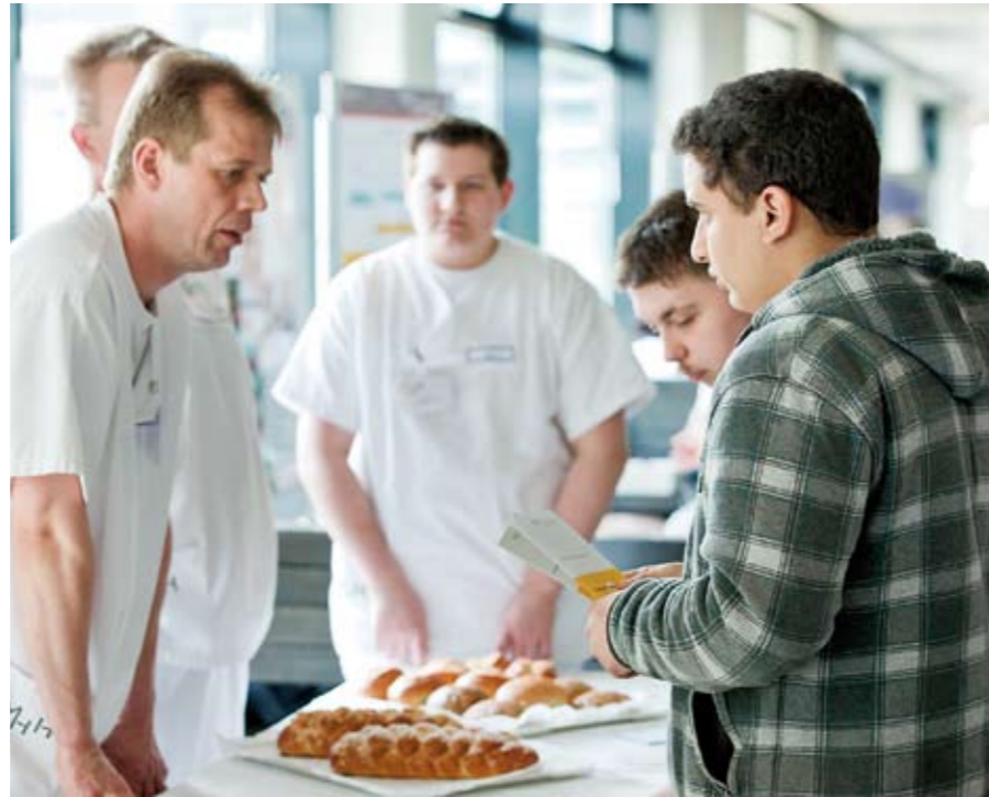
Starthilfe: Der Tag der Ausbildung bietet Informationen aus erster Hand.

Weitere Informationen unter www.mh-hannover.de/lebenundlernen.html