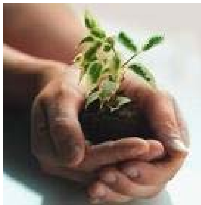
Für den Personalrat hat der Schutz der Arbeitsverhältnisse - unabhängig von der Rechtsform - höchste Priorität

Von den Gewerkschaften kam der wichtige Hinweis, dieses unbedingt in einer Vereinbarung mit dem neuen Arbeitgeber „Stiftung MHH“ abzusichern. In der 2002 für einen möglichen Rechtsformwechsel abgeschlossenen Vereinbarung zwischen dem MHH-Präsidium und verdi/Marburger Bund war festgelegt, für zehn Jahre betriebsbedingte Kündigungen auszuschließen.