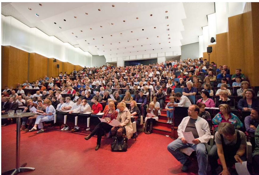
Großes Interesse am Thema Stiftung. Der Hörsaal A war überfüllt - alle Treppen und Freiflächen wurden als Sitz- und Stehplätze genutzt.