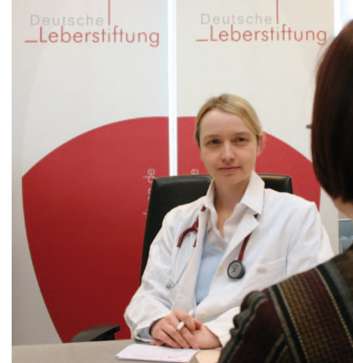
... und Beratung verbessern die Patientenversorgung.

Die Faltblätter „Hepatitis B“ und „Hepatitis C“ für Betroffene und Angehörige erschienen bislang in 13 Sprachen. Migranten, die aus Ländern stammen, in denen diese Krankheiten häufiger vorkommen, und die daher öfter betroffen sind, werden so in ihrer Muttersprache informiert.