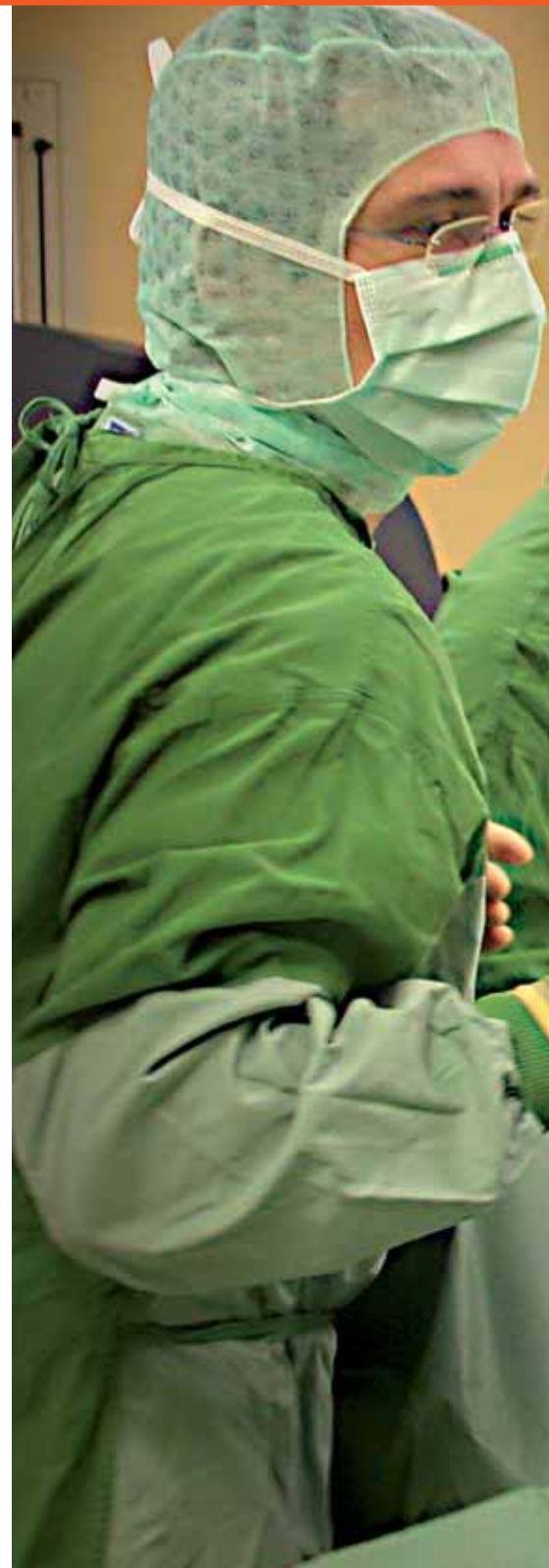
Im OP: MHH-Kinderchirurgie-Team während eines Eingriffs.

Das bisherige Fazit: „Es ist überwältigend, wie zufrieden die Patienten mit der