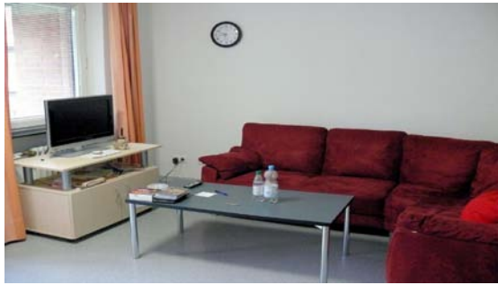
Ruhe- und Aufenthaltsraum der Station