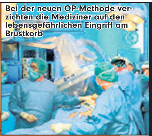
Bei der neuen OP-Methode verzichten die Mediziner auf den lebensgefährlichen Eingriff am Brustkorb