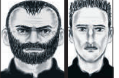
Mit diesen Phantom-Skizzen fahndet die Polizei nach den Hotel-Räubern

Laatzen - Der eine hat einen länglichen Eier-Kopf, der andere einen struppigen Bart und grimmigen Blick: Das sind die beiden Hotel-Räuber aus Laatzen! Mit diesen Phantombildern fahndet die Polizei nach den Gangstern. Das Duo überfiel mit einem dritten Komplizen am 3. März ein Hotel an der Münchener Straße. Sie fesselten den Nachtportier (22), stahlen rund 1000 Euro aus der Kasse. Das Opfer konnte sich selbst befreien, rief die Polizei. Die Ermittler suchen jetzt Zeugen, fragen: Wer kennt die Männer? Hinweise unter: ☎ 0511/109-5222.