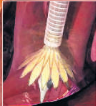
Stent und Klappe werden per Katheter in die verengte Aortenklappe geschoben. Im unteren Bereich sieht man die nicht richtig geöffnete Klappe (Systole)